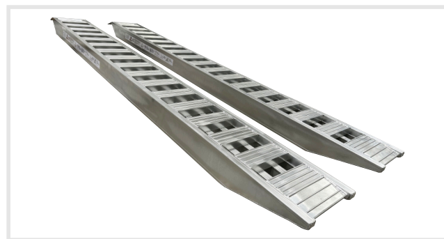
Barra aberta (1)