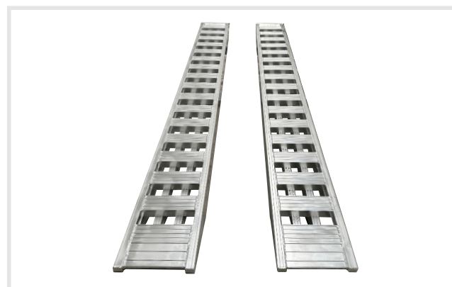
Barra aberta (2)