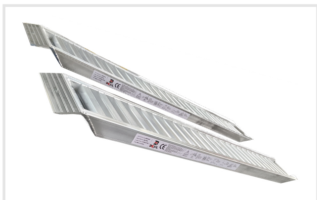
Barra fechada (2)